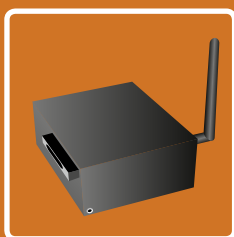
Boîtier de communication